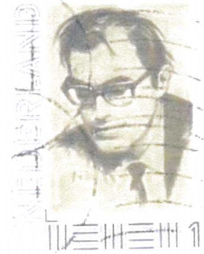
Godfried Bomans op een herdenkingspostzegel

In 1969 maakt Godfried Bomans de balans op van bijna 2000 jaar christendom. Op de hem eigen wijze prikkelt hij het denken, ook nu. De spanning is voelbaar: samenlevingsvraagstukken, overweldigend in aard en omvang gepaard met de schijnbaar marginale uitstraling van het christen-zijn. Of is dat de verkeerde voorstelling van zaken en is er meer sprake van 'gespannen nieuwsgierigheid'? Waar gaat het heen? Wordt in een tijd van droogte werkelijk geput uit de Bron? Zal de druk creatief, scheppend uitwerken? Worden we als christenen naar de zijkant geschoven, maar weigeren we een toeschouwersrol te vervullen? Bij het naderen van die wending, 2000 jaar na Christus, dringen de vragen.