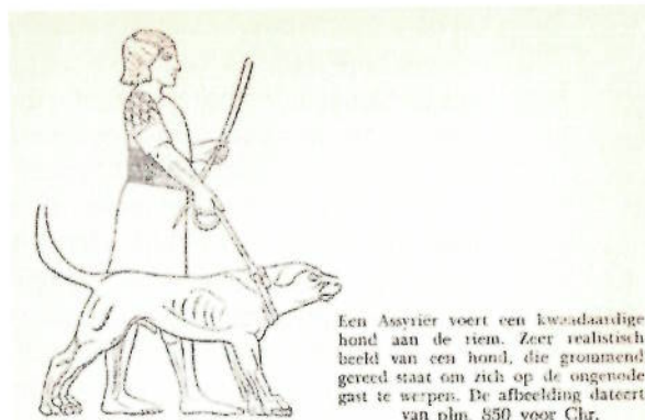
Een Assyriër voert een kwadaardige hond aan de riem. Zeer realistisch beeld van een hond, die grommend gereed staat om zich op de ongenode gast te werpen. De afbeelding dateert van plm. 850 voor Chr.

Joods beeldmateriaal over dieren rond 30 nC vond ik niet. In Dierenleven in de Bijbel zijn wel illustraties uit omliggende culturen opgenomen. Zo zie je een kat die een vis verorbert. Een leeuw die zijn klauwen zet in een hert. Een man die zich verweert tegen een hyena. En ook deze dreigende hond. Het is eten of gegeten worden. In die tijd oriënteerde je je vooral op de natuur. Jezus: "Kijk eens naar de vogels..." (Lucas 12:24). Hier ter geruststelling: maak je geen zorgen, doen vogels ook niet. Maar ook, zie je een gier rondcirkelen weet dan: daar ligt een dood dier. (Lucas 17:27). Al kan het ook een mens in nood zijn. Wat doe je dan? Ga je eraan voorbij of verzorg je die gewonde en geef je hem jouw plek op je ezel? (Lucas 10:34). Er wordt iets van rangorde zichtbaar. Kinderen gaan vóór honden. (Marcus 7:27). Kwetsbare schapen verdienen bescherming tegen bedreigende wolven. Maak zichtbaar wat er van binnen bij je leeft. (Johannes 10:11-15). De teneur die ik oppik uit allerlei uitspraken van Jezus is: heb oog voor je medemens én voor het dier. Leef ecocentrisch i.p.v. egocentrisch.